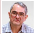
شهریار زرشناس جامعه‌شناس فرهنگی