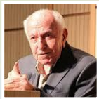
سیدحسین حسینی تبریزی متخصص منطق ارسطویی