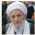
آیت الله مهدوی کنی دبیر کمیته انقلاب اسلامی