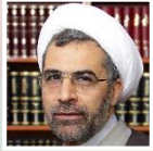
کارشناس: حجت الاسلام رسول جعفریان